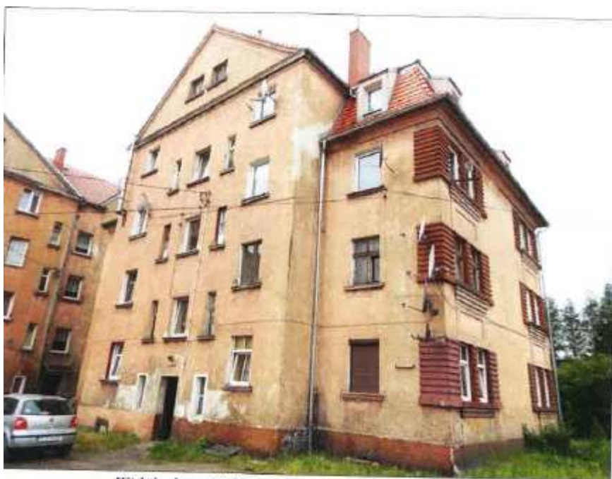
Widok elewacji frontowej – ul. Juliusza Słowackiego.

na sprzedaż lokalu mieszkalnego Nr 8, znajdującego się w budynku położonym w Lubaniu przy ul. Juliusza Słowackiego 15C wraz z udziałem we współwłasności nieruchomości gruntowej (działka nr 58/9, AM 14, Obręb I o powierzchni 248 m 2 , JG1L/00023916/1)